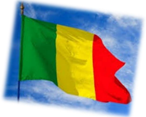
Drapeau du Mali

Paris → Bamako Moins de 6 heures d'avion