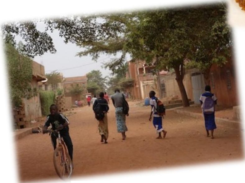
Des jeunes dans la rue à Bamako