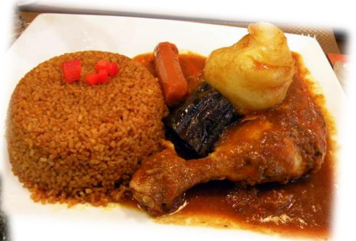
Le Tiep, plat traditionnel